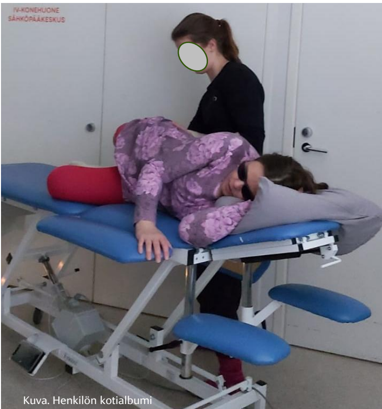
Kuva. Henkilön kotialbumi