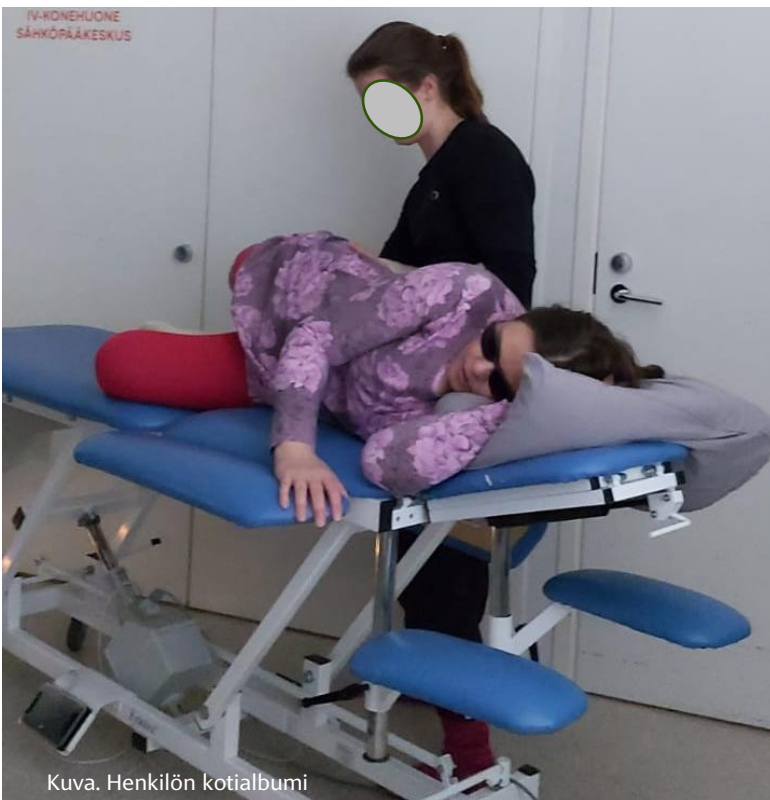
Kuva. Henkilön kotialbumi